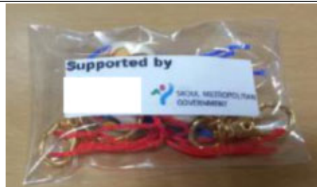
부적절한 로고 증빙 (스티커 부착)