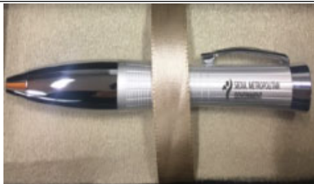
적절한 로고 증빙 (인쇄)